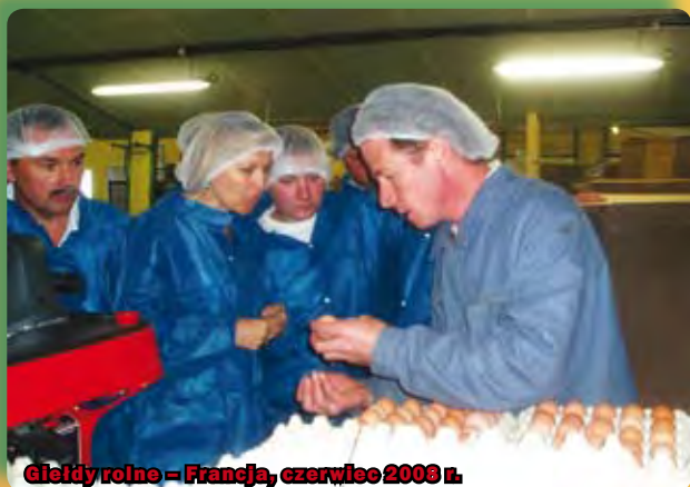
Giełdy rolne – Francja, czerwiec 2008 r.