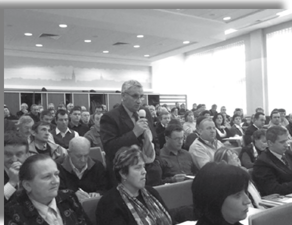
Fot.4. „Aktualna sytuacja w rolnictwie”, Nowy Targ, 15.12.2008 r.

Reagując na aktualne problemy nurtujące małopolskich rolników Izba organizuje również konferencje i seminaria. W ciągu 15 lat działalności odbyło się ponad 70 tego typu spotkań, w których uczestniczyło około 6 850 rolników.