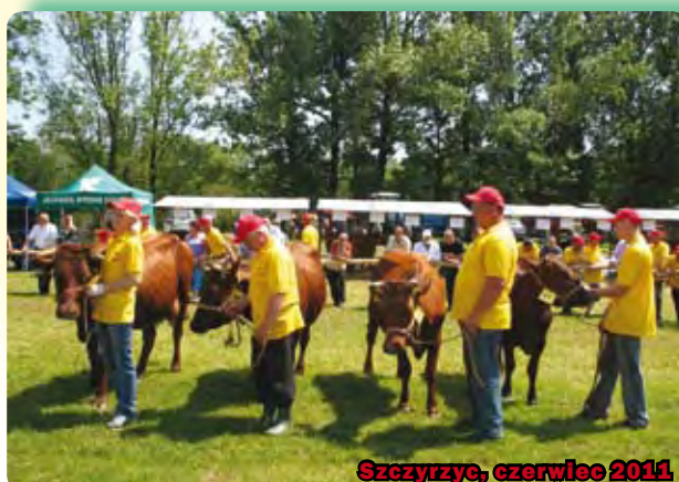
Szczyrzyc, czerwiec 2011