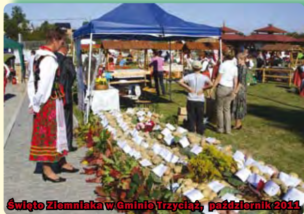
Święto Ziemniaka w Gminie Trzyciąż, październik 2011