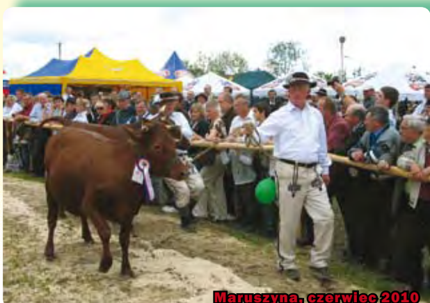
Maruszyna, czerwiec 2010