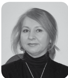
Opracowanie: Lucyna Chęcińska

Małopolska Izba Rolnicza od początku swej działalności zdecydowanie wspiera i promuje podejmowaną przez rolników działalność agroturystyczną, która jako dodatkowa działalność uzupełnia dochody rolników osiągane z produkcji rolniczej. Już w Nowosądeckiej Izbie Rolniczej zostało utworzone stanowisko specjalisty ds. agroturystyki. Po połączeniu Izb te działania zostały rozszerzone na całą Małopolskę. W ramach wsparcia MIR organizuje szkolenia dla rolników zajmujących się agroturystyką oraz realizuje projekty, których celem jest promocja agroturystyki w naszym województwie.