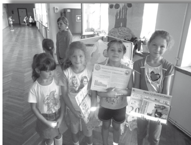
Fot. 3 i 4. Półkolonie w Stróżówce (Gmina Gorlice) – sierpień 2011.