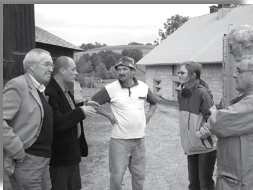
Fot.4. „Mleczarstwo i hodowla bydła” – wizyta ekspertów z Francji, czerwiec 2009 r.

W ramach wieloletniej współpracy zagranicznej zajęto się wieloma istotnymi zagadnieniami z zakresu rolnictwa. Spośród wszystkich wymienić można np.: „Perspektywy polskiego mleczarstwa w Małopolsce” (Międzynarodowa Konferencja Mleczarska w 2005 r.), „Marki i produkty regionalne, giełdy rolne i grupy producenckie” (wizyta ekspertów z Francji w 2005 r.), „Rozwój obszarów wiejskich poprzez budowę infrastruktury turystycznej” (wyjazd 10-osobowej delegacji MIR do Francji w 2006 r.), „Strukturyzacja sieci agroturystycznych” (wizyta ekspertów z Francji w czerwcu 2007 r.), „Ekonomia i koszty produkcji” (międzynarodowa konferencja w lutym 2008 r.).