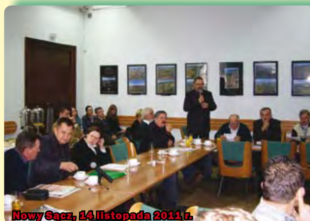
Nowy Sącz, 14 listopada 2011 r.