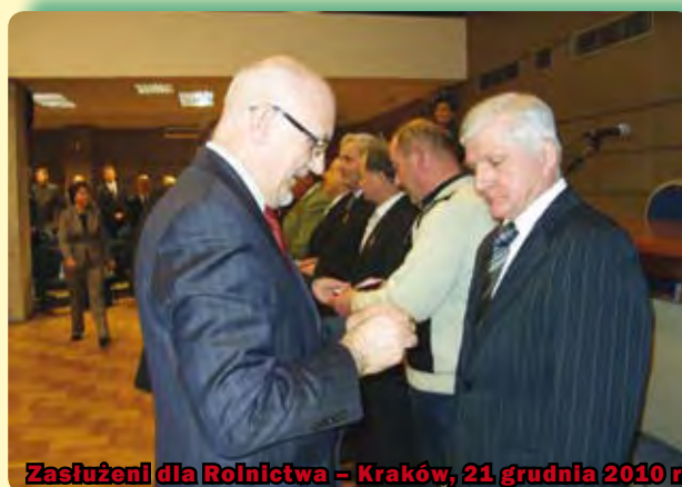
Zasługi dla Rolnictwa – Kraków, 21 grudnia 2010 r.