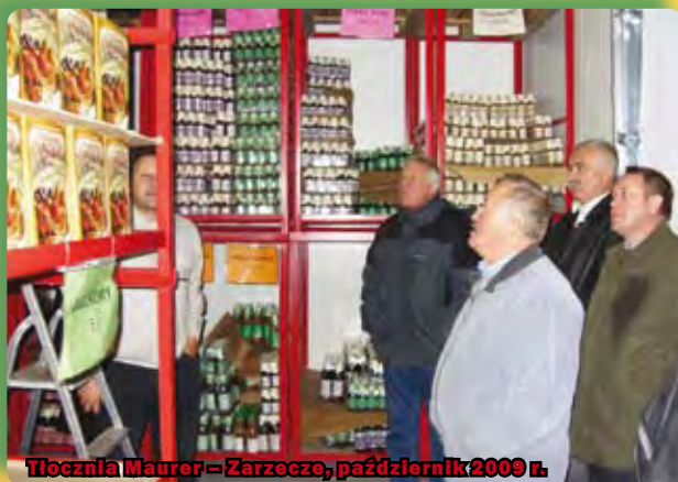
Tłocznia Maurer – Zarzecze, październik 2009 r.