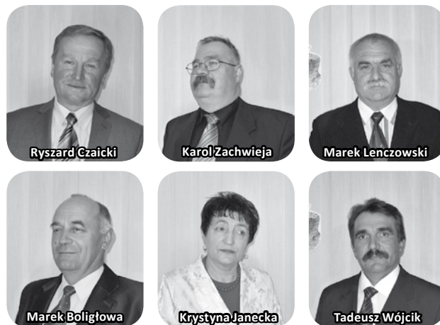
Fot.2. Zarząd IV kadencji Małopolskiej Izby Rolniczej

Obecnie trwa IV kadencja MIR – ostatnie wybory do izb odbyły się 3 kwietnia 2011 r. Podczas I posiedzenia WZ, które odbyło się w maju br. wybrano kolejny Zarząd MIR w następującym składzie: