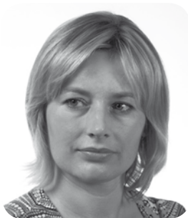
Opracowanie: Barbara Czapla

Wśród ważnych dokonań Izby, z pewnością wymienić należy podjęcie starań oraz doprowadzenie do wpisania w unijnych rejestrach dwóch małopolskich produktów: suski sechłońskiej i fasoli Piękny Jaś z Doliny Dunajca.