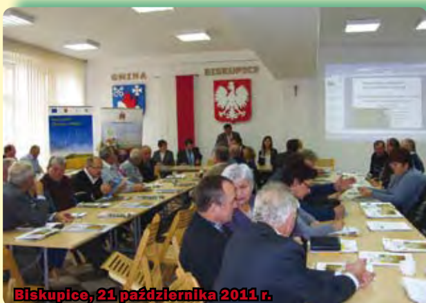
Biskupice, 21 października 2011 r.