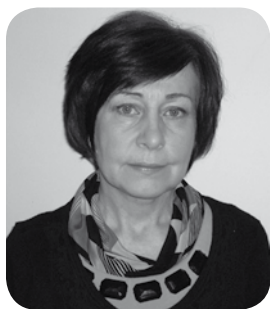
Opracowanie: Alicja Kostuś

Małopolska posiada specyficzne walory krajobrazowe i produkcyjne oraz bogate tradycje. Na południu, w terenach górskich i podgórskich, dominuje wielokierunkowa produkcja oraz hodowla zwierząt i sadownictwo. Na północy województwa zdecydowanie przeważa rolnictwo specjalistyczne