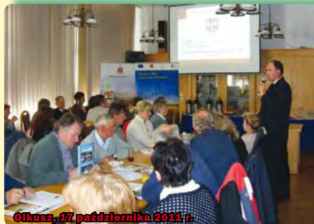
Olkusz, 17 października 2011 r.