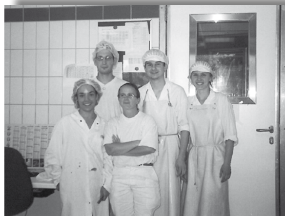
Fot.1. Szkoła mleczarstwa – staż dla studentów AR w Krakowie we Francji, 2004 r.

Alpes. W latach 2003-2004 obok intensywnie prowadzonej współpracy ze stroną francuską MIR nawiązała kontakty bądź gościła partnerów z innych krajów Europy m.in. z Włoch, Słowacji, Hiszpanii, Finlandii, Słowenii, Danii, Węgier i Irlandii. W tym okresie zorganizowano również wiele staży dla polskich i francuskich studentów jak np. staż dla studenta z Francji w biurze MIR w Krakowie oraz wyjazd stażowy dwóch studentek z Akademii Rolniczej w Krakowie do Szkoły Mleczarstwa w La Roche sur Foron we Francji.