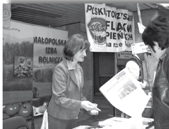
Fot.2. Stoisko MIR podczas Giełdy Agroturystycznej, kwiecień 2009 r.

Uczestniczyliśmy również w imprezach lokalnych odbywających się w okolicznych miejscowościach takich jak: Estrada pod Lipami w Starym Sączu, Inauguracja splotu Przełomem Dunajca w Sromowcach Niżnych, oraz w wielu innych lokalnych imprezach dożynkowych.