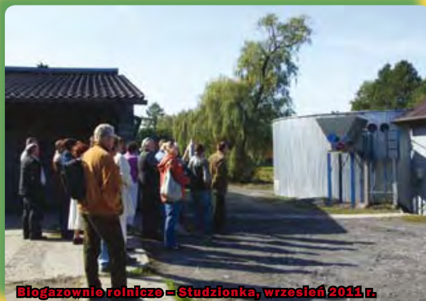
Biogazownie rolnicze – Studzionka, wrzesień 2011 r.