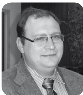
Opracowanie: Marcin Słowik

Geneza organizacji Wystaw Zwierząt Hodowlanych w Klikowej to nie tylko historia jeszcze jednej imprezy organizowanej w naszym województwie ale, może przede wszystkim, historia pasji i uporu kilku ludzi, którzy na przekór wielu sceptykom postanowili udowodnić, że w Tarnowie można zorganizować dużą imprezę rolniczą.