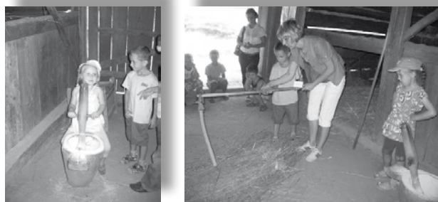
Fot. 1 i 2. Półkolonie dla dzieci z Gminy Wieprz – sierpień 2011.