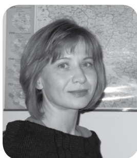
Opracowanie: Jolanta Kałmuk

P odnoszenie kwalifikacji osób zatrudnionych w rolnictwie to jedno z najważniejszych zadań statutowych izby. Dzięki szkoleniom rolnicy – członkowie izby – doksztalcają się lub zdobywają nowe kwalifikacje i doświadczenie, pozwalające na wypracowanie wyższego dochodu z gospodarstwa lub pozyskanie dodat-