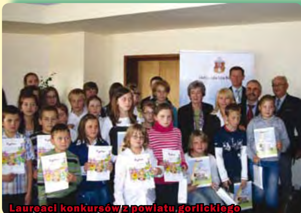
Laureaci konkursów z powiatu gorlickiego