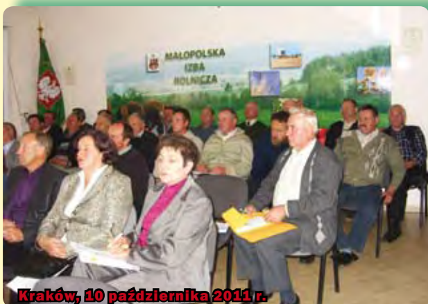
Kraków, 10 października 2011 r.