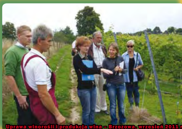
Uprawa winorośli i produkcja wina – Brzozowa, wrzesień 2011 r.