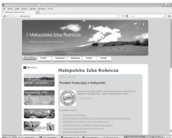
Fot.5. Strona startowa MIR: www.mir.krakow.pl

Od początku swej działalności Izba posiada stronę internetową (aktualnie: www.mir.krakow.pl ). Znajdują się tutaj m.in. informacje dotyczące bieżącej działalności MIR (szkolenia, ważne spotkania, wystawy i targi rolnicze, współpraca zagraniczna), ważne komunikaty dla rolników, aktualności branżowe oraz informacje prawne. Na stronie zamieszczane są również projekty aktów prawnych, analizy miesięczne i Informatory MIR (od 2007 r.) oraz foto-relacje ze spotkań i imprez plenerowych, w których Izba aktywnie uczestniczy. Od roku 2008 naszą stroną internetową odwiedziło 80 450 osób (stan na dzień 5 stycznia 2011).