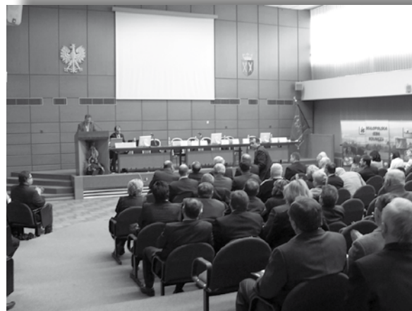
Fot.3. „Perspektywy małopolskiego rolnictwa” – Kraków, 09.03.2009 r.