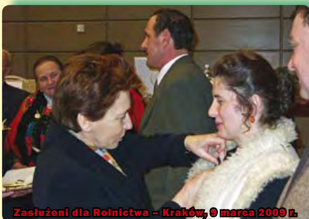
Zasługi dla Rolnictwa – Kraków, 9 marca 2009 r.