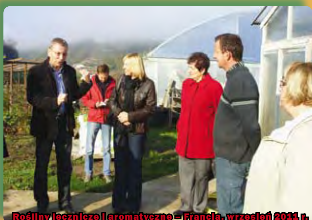
Rośliny lecznicze i aromatyczne – Francja, wrzesień 2011 r.