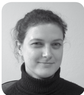
Opracowanie: Joanna Krasicka

Początki współpracy zagranicznej sięgają roku 1997, kiedy to ówczesnie działające w Małopolsce Izby: Krakowska, Tarnowska i Nowosądecka nawiązały pierwsze kontakty z partnerami zagranicznymi. Długa, 50-letnia przerwa w istnieniu izb w Polsce spowodowała, że odradzające się jednostki nie mogły skorzystać z pomocy ojczystych przykładów i doświadczeń w zakresie funkcjonowania organizacji rolniczych. Na szczęście, w tej sytuacji, izby otrzymały wsparcie i pomoc od zagranicznych partnerów zwłaszcza od izb francuskich. W 1997 r. Krakowska Izba Rolnicza rozpoczęła współpracę z dwoma izbami francuskimi: Izbą Rolniczą Regionu Nord Pas de Calais oraz Izbą Rolniczą Departamentu Mayenne; Tarnowska Izba Rolnicza z Izbą Rolniczą Departamentu Doubs; a Nowosądecka Izba Rolnicza z Izbą Rolniczą Departamentu Savoie.