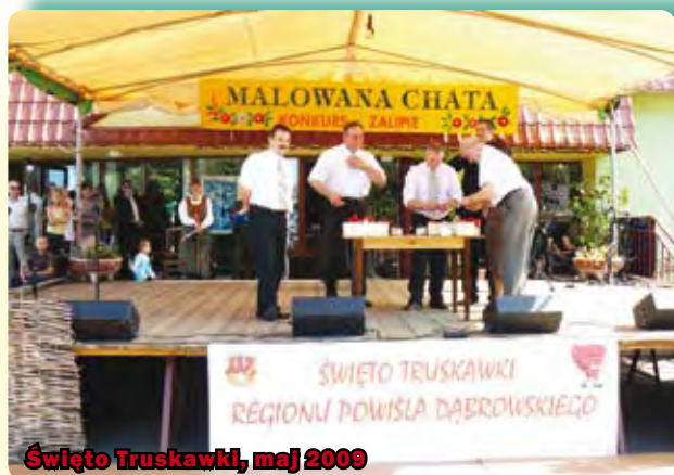
Święto Truskawki, maj 2009