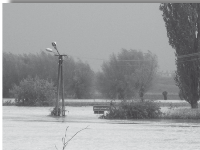
Fot.1. Okolice Wietrzychowic, maj 2010.

(ok. 105 t zboża, 14 t pasz treściwych, 7 t siana, ok. 21 t sianokiszonki, 6 t słomy, 600 kg mieszanki pełnowartościowej typu „B”, 300 kg buraków i 470 kg ziemniaków); artykułów spożywczych (cukier, mąka, chleb – zarówno świeży jak i suchy, 600 gorących posiłków) i środków czystości. Z budżetu MIR został częściowo pokryty transport zebranych darów, ponadto Izba zakupiła i przekazała 4,5 t siana i 11 t pasz treściwych.