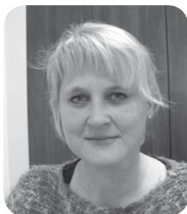
Opracowanie: Dorota Korepta-Kura

Małopolska Izba Rolnicza od 2003 r. przygotowywała rolników do wypełnianie wniosków: najpierw o wpis do ewidencji gospodarstw, a potem o dopłaty bezpośrednie.