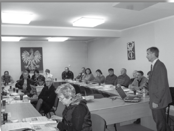
Fot.2. „Technologia produkcji mięsa (...)” – Wolbrom, 22.11.2011 r.