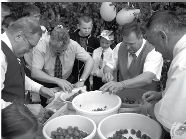
Fot.1. III Święto truskawki – Nieczajna Górna 19.06.2005 r.