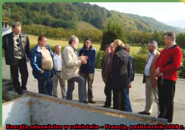
Energia odnawialna w rolnictwie – Francja, październik 2008 r.