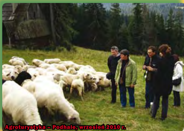
Agroturystyka – Podhale, wrzesień 2010 r.