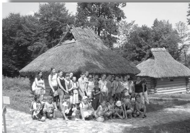
Zwiedzanie skansenu archeologicznego w Trzcinicy.

Organizacją wypoczynku dla dzieci zajmowały się: Związek Zawodowy Centrum Narodowe Młodych Rolników (ZZ CNMR), Związek Młodzieży Wiejskiej w Krakowie (ZMW), Krajowa Rada Izb Rolniczych (KRIR) oraz Kasa Rolniczego Ubezpieczenia Społecznego (KRUS). Wyjazdy są dofinansowane z Funduszu Składowego Ubezpieczenia Społecznego Rolników, stąd mogą z nich korzystać tylko dzieci z rodzin posiadających gospodarstwo rolne.