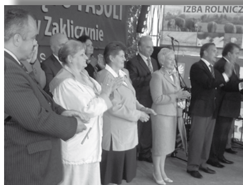
Obchody X Święta Fasoli, Zakliczynie 12–13.09.2009 r.

Niewątpliwą zasługą Izby jest również inicjatywa organizacji Święta Fasoli – odbywającego się od 11 lat w Zakliczynie – oraz powołanie do życia Spółdzielni „Dolina Dunajca”, która przy pomocy Izby kontynuowała działania mające na celu wpisanie fasoli do unijnych rejestrów.