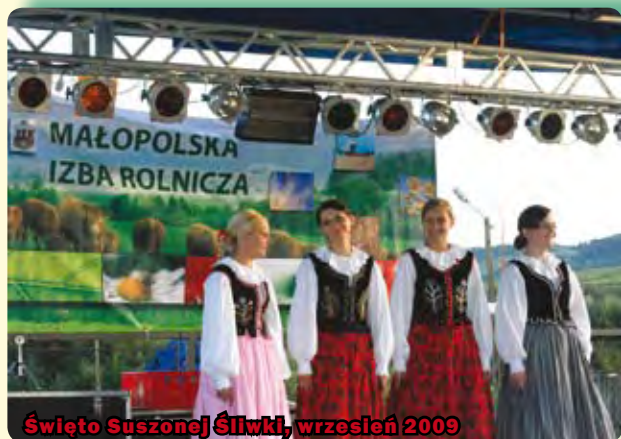
Święto Suszonej Śliwki, wrzesień 2009