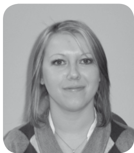
Opracowanie: Jolanta Mocniak

Każdego roku Izba podejmuje szereg działań mających na celu rozwiązanie rozlicznych problemów, z którymi borykają się małopolscy rolnicy. Interwencje te mają zazwyczaj formę wniosków i postulatów – zgłaszanych oddolnie przez poszczególne rady powiatowe MIR z całego województwa – kierowanych