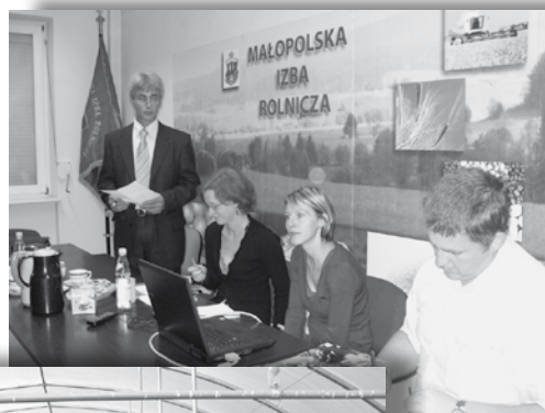
Fot.5. „Uprawa winorośli i produkcja wina” – wizyta eksperta z Francji, sierpień 2011 r.

Ostatnie lata współpracy to głównie wspólne projekty i intensywne wymiany z Regionalną Izbą Rhône Alpes. Wspólnie zrealizowano obustronne wizyty studyjne w temacie uprawy winorośli i produkcji wina (sierpień 2009 r., lipiec i wrzesień 2011 r.), energii odnawialnej (wrzesień 2008 r., październik 2009 r., wrzesień 2009 r.), ferm pedagogicznych (wrzesień 2010 r.), uprawy roślin aromatycznych i leczniczych (listopad 2011 r.).