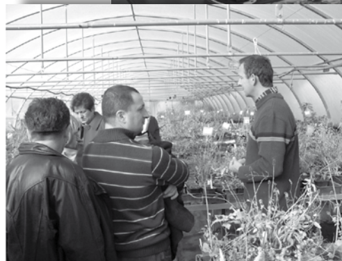
Fot.6. „Rośliny lecznicze i aromatyczne” - wyjazd małopolskich producentów do Francji, listopad 2011 r.

Podczas 15 lat współpracy przekazywane przez zagranicznych partnerów doświadczenie, propozycje oraz cenne wskazówki w miarę możliwości przenoszono na grunt polski. Od początku swojego istnienia izb w Małopolsce zorganizowano 121 wymian w tym 81 z partnerami francuskimi i 40 z innych krajów, w których łącznie uczestniczyło 692 gości zagranicznych i 952 osób z Polski (patrz tabela). Obecnie współpraca skupia się przede wszystkim na korzystaniu z wiedzy, jaką mogą nam przekazać zagraniczni eksperci w dziedzinach związanych z rolnictwem, ale również na przekazaniu zdobytego przez MIR doświadczenia partnerom z innych krajów Europy i świata.