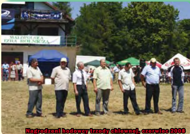
Nagrodzeni hodowcy trzody chlewniej, czerwiec 2008