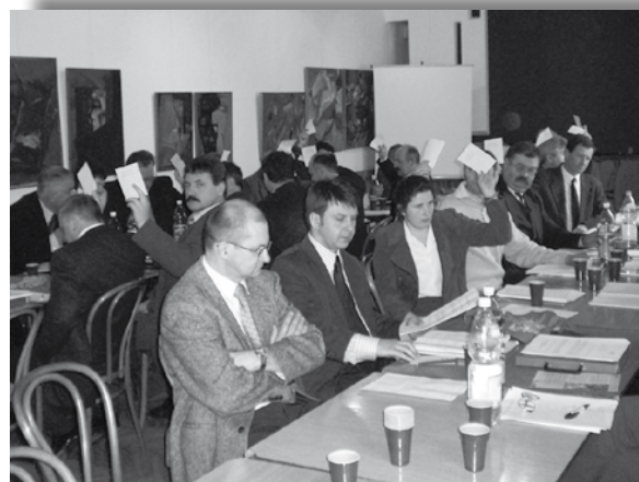
Fot.1. I posiedzenie WZ MIR III kadencji, marzec 2007 r.

8 grudnia 2002 r. odbyły się wybory delegatów do Małopolskiej Izby Rolniczej II kadencji. W wyniku znowelizowanej ustawy o izbach rolniczych, w miejsce dotychczasowych oddziałów powstało 19 rad powiatowych, które do dziś funkcjonują w każdym powiecie Małopolski. Na posiedzeniu Walnego Zgromadzenia MIR II kadencji dokonano wyboru kolejnego Zarządu MIR (2002–2007):