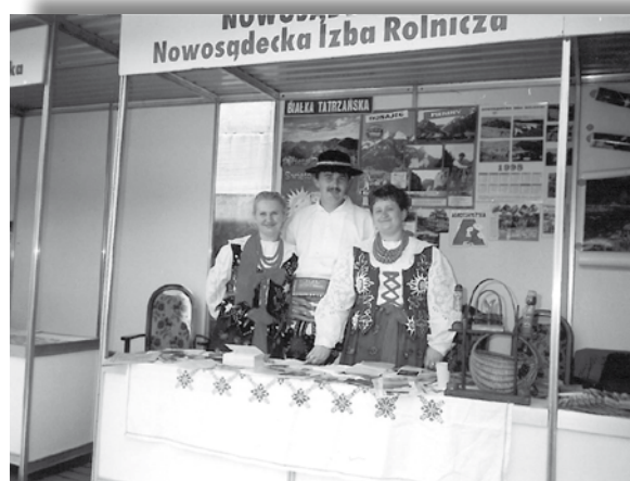
Fot.1. Stoisko NIR – Jarmark Agroturystyczny, Warszawa 1998 r.

Do najważniejszych wydarzeń promujących agroturystykę, w których Izba aktywnie uczestniczyła należą: Małopolska Giełda Agroturystyczna w Krakowie, Jarmark Agroturystyczny w Warszawie, Międzynarodowe Targi – Regiony Turystyczne w Łodzi, Krakowski Salon Turystyczny, Międzynarodowe Targi Turystyczne w Katowicach, Targi Turystyki i Wypoczynku w Warszawie, Międzynarodowe Targi Turystyczne w Złotowie, Targi Turystyczne w Poznaniu, Polagra w Poznaniu, Jarmark Galicyjski w Tarnowie, Targi Zdrowej Żywności w Tarnowie.