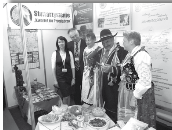
Fot.1. Stoisko Stowarzyszenia GGG – Targi Agroturystyczne, Sejny 2011 r.