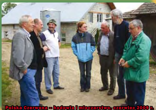
Polska Czerwona – hodowla i mleczarstwo, czerwiec 2009 r.