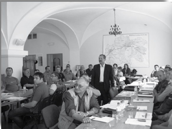
Fot.1. „Szacowanie szkód łowieckich” – Limanowa, czerwiec 2011 r.

MIR organizuje też szkolenia dotyczące szacowania szkód łowieckich, ubezpieczeń upraw i zwierząt gospodarskich, obrotu materiałem siewnym itp.