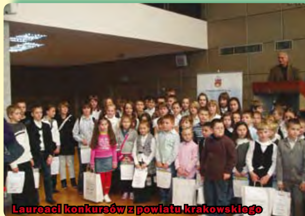
Laureaci konkursów z powiatu krakowskiego