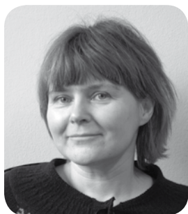
Opracowanie: Jolanta Sawińska

Pierwsze izby rolnicze w Małopolsce, po ich likwidacji w 1946 r., powstały w Krakowie i Tarnowie w 1990 r. na podstawie ustawy o izbach gospodarczych z 1989 r. Utworzone wówczas izby otrzymały do dyspozycji symboliczne środki finansowe – w Tarnowie była to kwota 15 tys. zł. Z takim kapitałem Izby nie przetrwały długo.