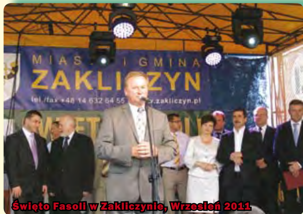
Święto Fasoli w Zakliczynie, Wrzesień 2011