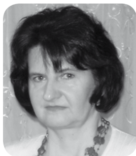
Opracowanie: Katarzyna Węgiel

Od roku 2006 Izba była współorganizatorem wakacyjnego wypoczynku dla dzieci i młodzieży wiejskiej, w zakresie organizacji naboru uczestników, a w przypadku półkolonii – również organizacji kadry opiekuńczo-wychowawczej i miejsca wypoczynku.