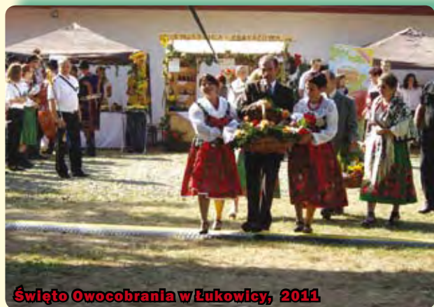
Święto Owocobrania w Łukowicy, 2011