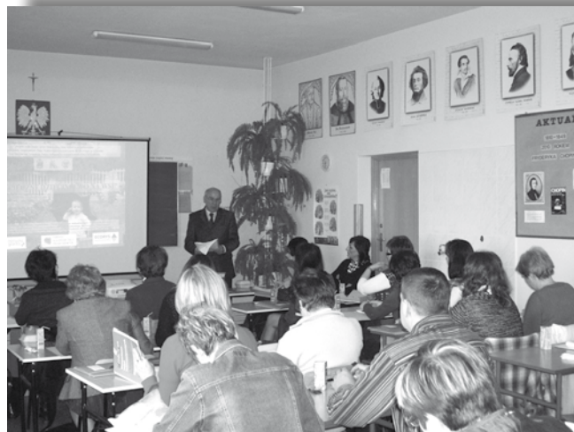
Fot.1. „Bezpieczne dzieciństwo na wsi” – szkolenia dla nauczycieli, Podegrodzie, 14.04.2010 r.