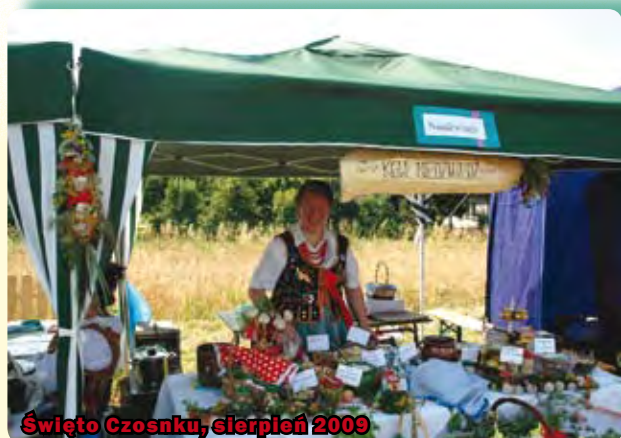
Święto Czosku, sierpień 2009